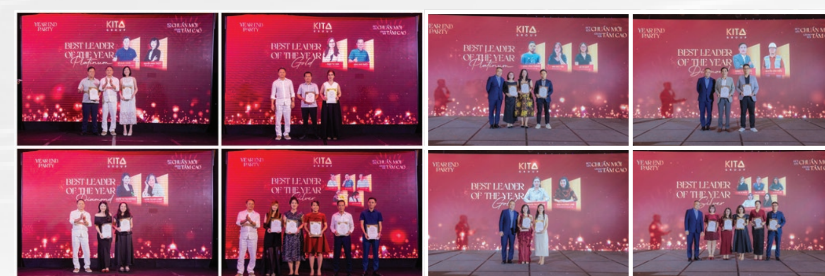
▲ Vinh danh các Quản lý xuất sắc – Best Leader of The Year khu vực Miền Bắc và Miền Nam