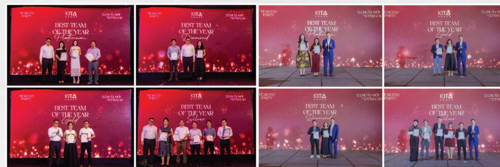
▲ Vinh danh các Tập thể xuất sắc – Best Team of The Year khu vực Miền Bắc và Miền Nam

Các hạng mục vinh danh Best Team of The Year, Best Leader of The Year và Best Performer of The Year lần lượt được trao cho những tập thể và cá nhân xuất sắc tại cả hai khu vực miền Nam và miền Bắc. Mỗi danh hiệu là sự ghi nhận xứng đáng cho tinh thần trách nhiệm, sự nỗ lực không ngừng và những đóng góp thiết thực vào sự phát triển chung của Tập đoàn.